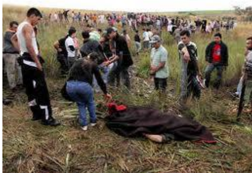
Un' immagine del massacro.

La versione immediata ed ufficiale dell'accaduto fu che i contadini armati avevano teso un'imboscata, si parlò anche di infiltrazione dell' EPP ( Ejercito del Pueblo Paraguayo ), alla quale il contingente di polizia reagì, difendendosi e reprimendo l' attacco.