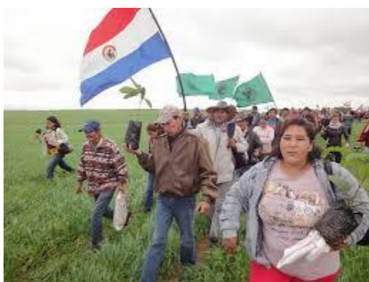
Ritorno a Curuguaty.