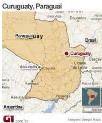
Mappa del Paraguay