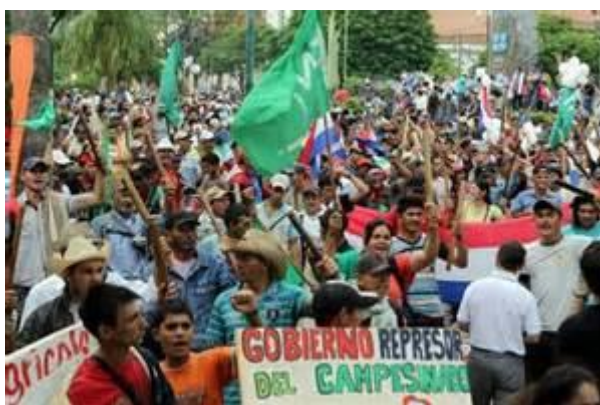
Manifestazione a ad Assunción.

Lo sciopero generale dello scorso 26 marzo, contro il governo neoliberale e di destra di Horacio Cateres proclamato dalla Federación Nacional Campesina (FNC), la Corriente Sindical Clasista (CSC), il Partido Paraguay Pyahurã (PPP) y la Organización de Trabajadores de la Educación (OTEP-SN). è stato un fatto storico, il primo dopo 20 anni ed il terzo in tutta la storia di Paraguay. Le rivendicazioni: aumento salariale del 25%, stop all'aumento di costo del trasporto pubblico e di altri prodotti e servizi pubblici, difesa del diritto di organizzazione e libertà sindacale, deroga delle leggi di Alianza Publico-